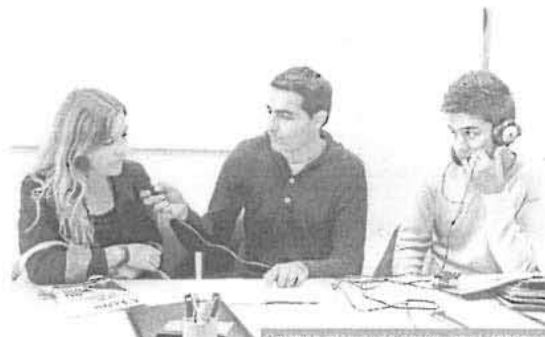
Debat entre interviewés par le journaliste Mohammed.